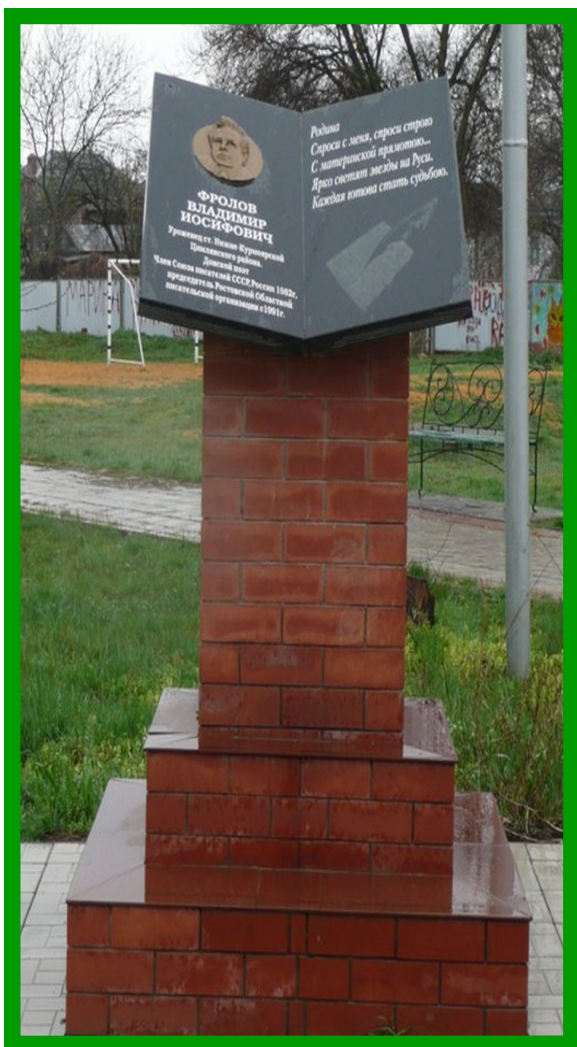
ПАМЯТНИК ФРОЛОВУ В.И. г. Цимлянск

Член Союза писателей СССР, России с 1982 года, поэт. С 1990 года по 1991 год – председатель правления Ростовской писатель- ской организации Союза писате- лей СССР. С 1991 года по 2006 год – председатель правления Ро- стовского регионального отделе- ния Союза писателей России.